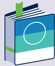
Bundesweite Fachorganisation und politische Interessensvertretung