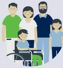
Begleitung der Familien zu Hause