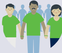
Förderung von ehrenamtlichem Engagement