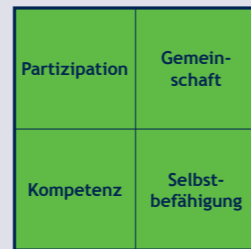
Stärkung der Selbsthilfe